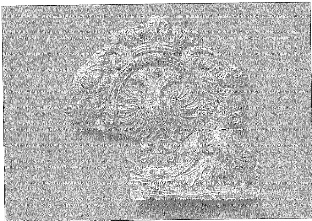
Ilustr. 2. Stargard, Stare Miasto, stan. 11 a. Wykop IV, cz. N. Kafel wieńczący z przedstawieniem orła cesarskiego, I ćw. XVII w.